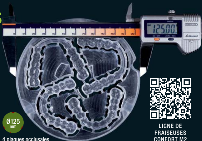
4 plaques occlusales