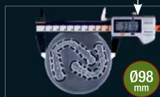
2 plaques occlusales